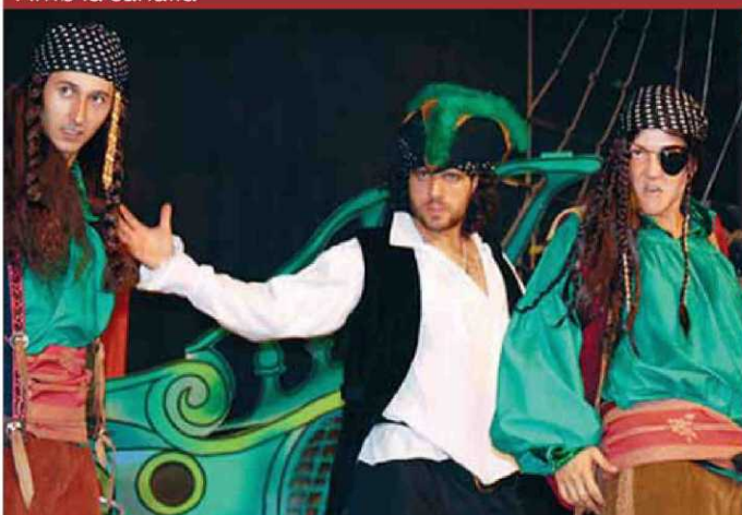
Tres dels protagonistes de 'Pirates: els joglars flotants'